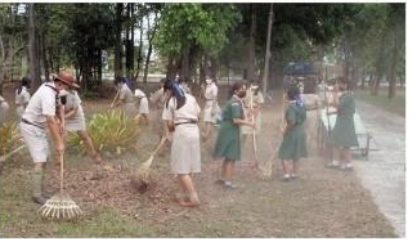
หน่วยลูกเสือจิตอาสาพระราชทานโรงเรียนศรีสมเด็จพิภพพัฒนาวิทยา ปฏิบัติกิจกรรมอาสาพัฒนา บริเวณส่วนราชการอำเภอศรีสมเด็จ วันเสาร์ที่ 19 กุมภาพันธ์ 2565