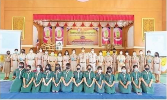
การฝึกอบบรมลูกเสือจิตอาสาพระราชทาน ระดับสถานศึกษา ระหว่างวันที่ 7-10 ก.พ. 2565 ณ โรงเรียนเตรียมอุดมศึกษาพัฒนาการร้อยเอ็ด