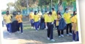
หน่วยลูกเสือจิตอาสาพระราชทานโรงเรียนศรีสมเด็จพิภพพัฒนาวิทยา ปฏิบัติกิจกรรมอาสาพัฒนาบริเวณวัดป่ากุง วันเสาร์ที่ 26 กุมภาพันธ์ 2565